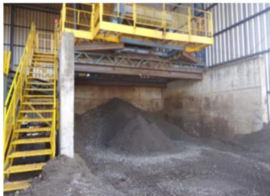
Figura 2. Resíduo Sólido Industrial Terra da Shredder

a maior parte das sucatas processadas na Shredder são provenientes de Veículos em Fim de Vida (VfV).