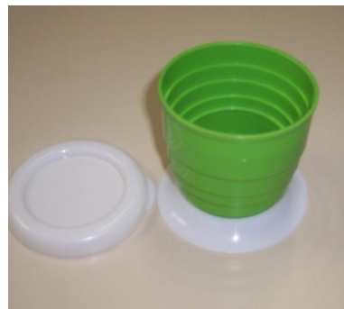
Canetas ecológicas e copos retráteis na Livraria