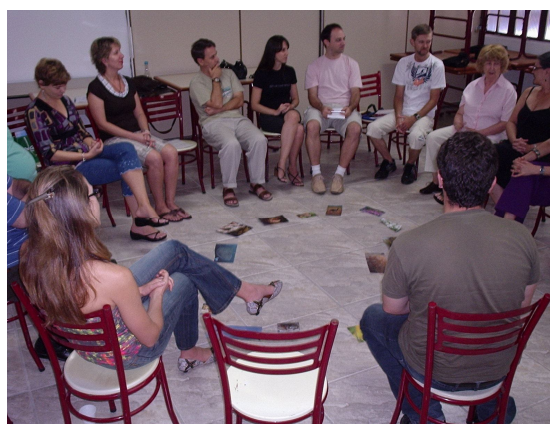
I Encontro da Equipe - jan/2009