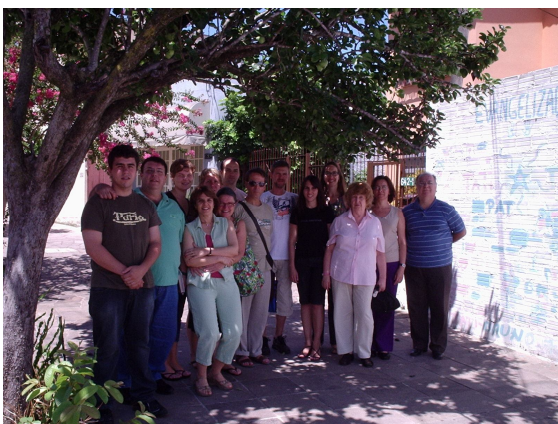
Equipe Gestão Ambiental SBEBM