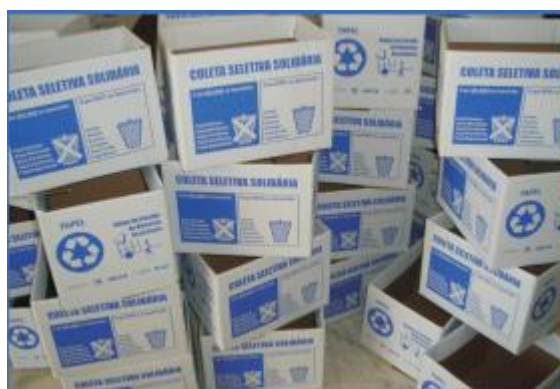
Figura 2- Caixas coletoras de papel do programa Coleta Seletiva UnB.

Houve a adaptação da infraestrutura nos campi para a correta coleta de resíduos, com a compra de caixas coletoras de papel e de novas lixeiras para os campi, pintura e recuperação de contêineres, criação de adesivos para as lixeiras e a execução da área de transbordo da prefeitura.